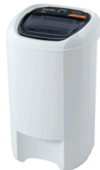
Ref 32492 CENTRIFUGA 15KG WANKE