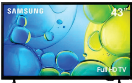
Ref 32363 TV SMART SAMSUNG 43"