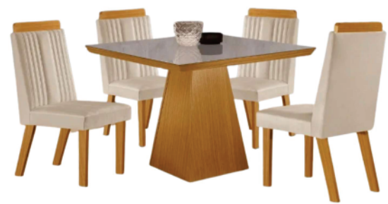
Ref 33855 CONJUNTO MESA PRADA TAMPO VIDRO

R$2.890,00 2.399,00 EM ATÉ 10X NO CARTÃO