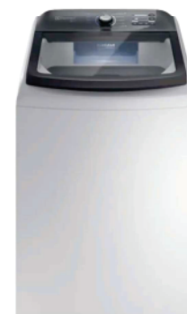
Ref 32933 LAVADORA ELECTROLUX LEE18 18KG

R$2.890,00 2.619,00 EM ATÉ 10X NO CARTÃO