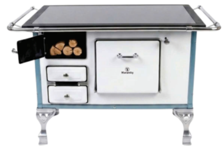
Ref 7443 FOGÃO À LENHA CHAPA VIDRO N01