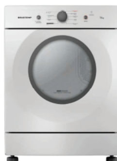
Ref 11666 SECADORA 10KG BRASTEMP

R$2.890,00 2.399,00 EM ATÉ 10X NO CARTÃO