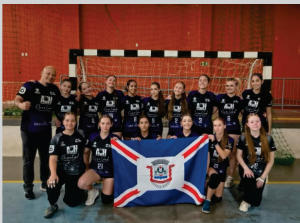
Handebol Feminino de União da Vitória conquista pódio em Iraty.

O Handebol Feminino de União da Vitória, conseguiu belo resultado na fase regional do JOJUPs _ Jogos da Juventude-, disputados em Iraty, neste final de semana. Vitória de 24 a 09 sobre Iraty empolgou já na primeira rodada. Depois empate em 12 x 12 com Guarapuava (jogo decidido no tiro livre de 7 metros, que terminou com derrota nossa. E No Jogo decisivo, União da Vitória perdeu para Pinhão (19 x 14). Com esses resultados, Pinhão conseguiu o título, vice Guarapuava e União da Vitória terceira