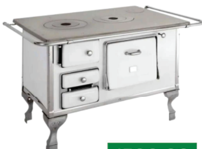
Ref 7443 FOGÃO À LENHA MARUMBY N01

R$2.890,00 2.619,00 EM ATÉ 10X NO CARTÃO