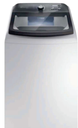
Ref 32933 LAVADORA ELECTROLUX LEE18 18KG

R$2.890,00 2.619,00 EM ATÉ 10X NO CARTÃO