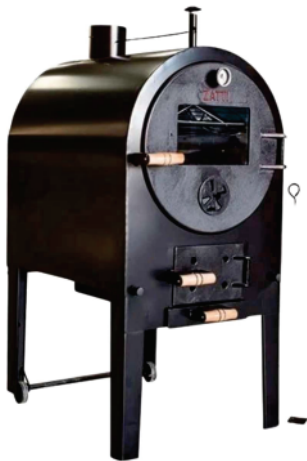
Ref 9294 FOGÃO À LENHA ZATTI