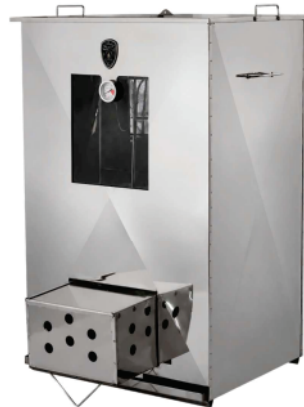
Ref 158268 CHURRASQUEIRA MULTIUSO INOX PINHAL

R$2.399,00 1.929,00 EM ATÉ 10X NO CARTÃO