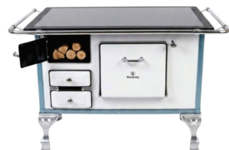
Ref 7443 FOGÃO À LENHA CHAPA VIDRO