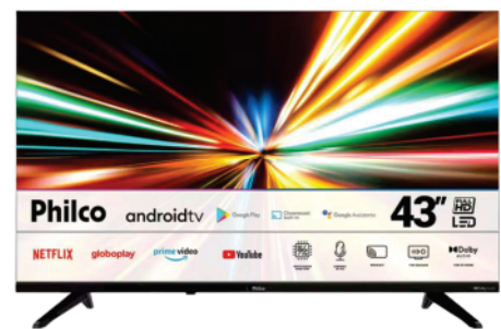
Ref 32968 TV SMART PHILCO 43"