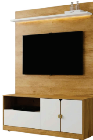
Ref 0218000 ESTANTE HOME MONZA