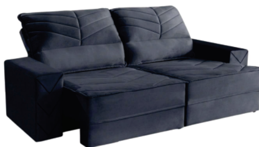
Ref 021754 ESTOFADO MALTA REQUINTE