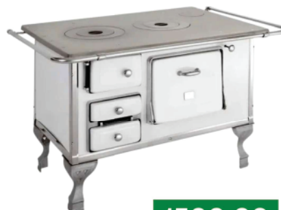
Ref 1425120 FOGÃO À LENHA MARUMBY N01