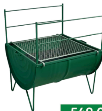
Ref 758985 CHURRASQUEIRA TAMBOR