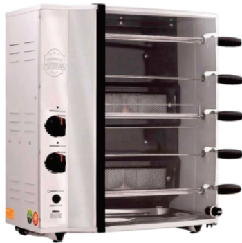
Ref 582693 ASSADOR MANUAL HIDRO