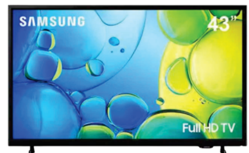
Ref 17498 TV SMART PHILIPS 32"