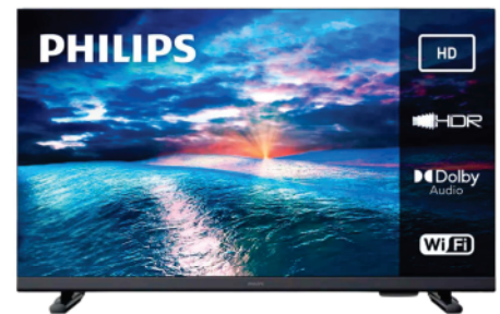
Ref 17498 TV SMART PHILIPS 32"