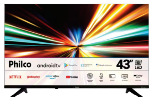
Ref 17498 TV SMART PHILIPS 32"