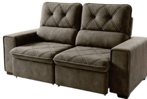
Ref 789526 ESTOFADO BAHAMAS DECOR