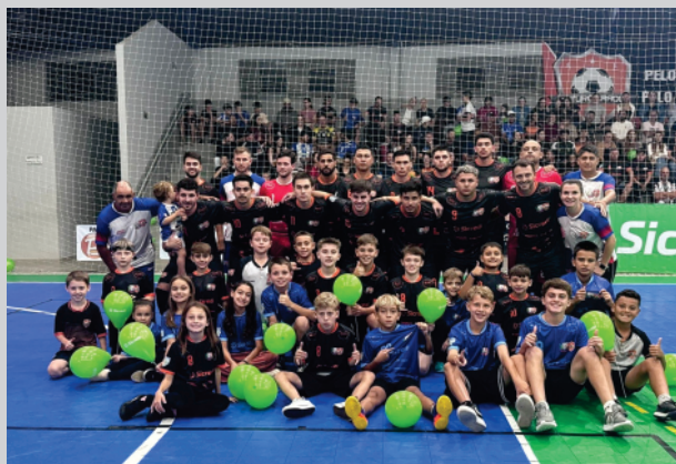
FUTURO CRAQUE joga em Casa, no ginásio municipal de Paula Freitas, neste sábado e precisa da vitória.

SFINGE recebe o time do PINHÃO , as 20 horas. Esse jogo terá ingresso solidário, sendo que o torcedor pode levar um kg de alimento ou embalagem de óleo de soja.