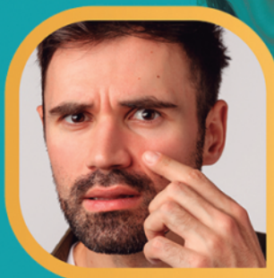
PREENCHIMENTO DE OLHEIRA