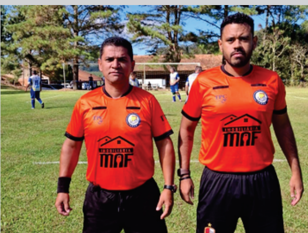
Arbitragem do DME, no campeonato do Interior de Porto União recebendo elogios pela postura e boa condução dos jogos.

O campeonato do Interior de Porto União tem semi finais das categorias Veteranos e Ouro marcadas para a o próximo domingo, dia 12 , na Comunidade do Maratá . Os jogos são os seguintes :