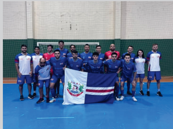
O Time do Futuro Craque/Paula Freitas perdeu na rodada do campeonato Paranaense de Futsal, Série Bronze. Grupo busca a regularidade para classificação.

Mesmo com feriadão da Páscoa, prosseguiu neste final de semana o campeonato paranaense de Futsal, Série Bronze, os jogos foram disputados no sábado. Os times da região apresentaram os seguintes resultados: Jogando em Pinhão, a SFINGE perdeu por 4 x 0 para o time local. Em Campina do Simão, a ADAB de Bituruna venceu o Campinense por 3 x 2. E o time do Futuro Craque/Paula Freitas, jogando fora de seu ginásio, perdeu para o Ipiranga 6 x 2. A Classificação, após quatro rodadas, na chave "B" é a seguinte :