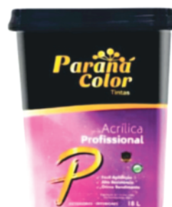
Tinta Acrílica ParanáColor 18L