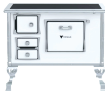
Fogão à Lenha Nº2 Chapa Vidro GII Venax