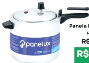
Panela Pressão 4,5L