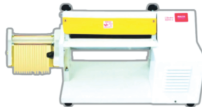
Cilindro Elétrico C/Laminador Malta