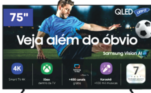
Ref 32015 TV Samsung 75"