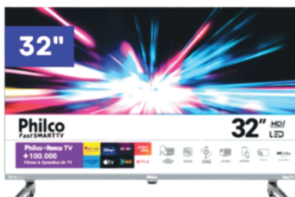
Ref 32015 TV Philco 32"