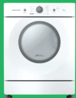
Secadora Brastemp BSR10 10Kg