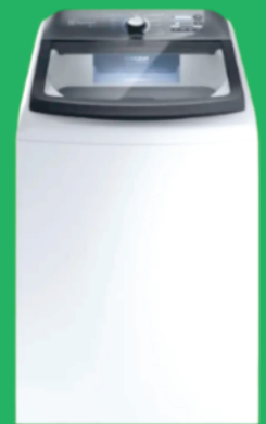
Lavadora Electrolux LEE18 18Kg