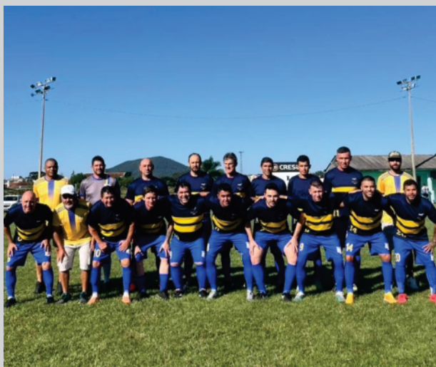
Veteranos do AEROPORTO venceu no final de semana pelo campeonato varzeano.

Com mais uma rodada completa, prosseguiu neste final de semana o campeonato varzeano de São Cristóvão, que está sendo considerado um dos mais disputados e equilibrados dos últimos anos. No sábado os resultados foram os seguintes: