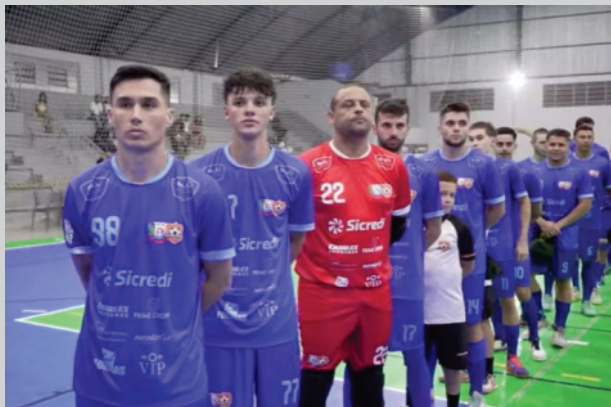
Time do Paula Freitas/Futuro Craque, jogou bem e conseguiu mais uma vitória no Paranaense Série Bronze.