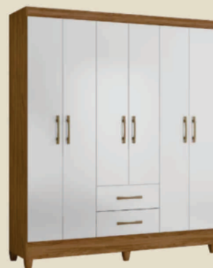
Roupeiro 6 portas e 2 gavetas