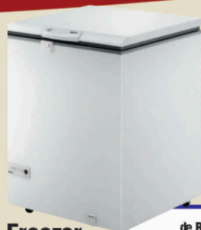
Freezer Horizontal Consul - 220 l