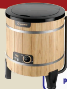
Lavadora tradicional Wanke 5 kg