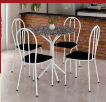
Mesa redonda c/ 4 cadeiras e tampo de pedra Lazaretti