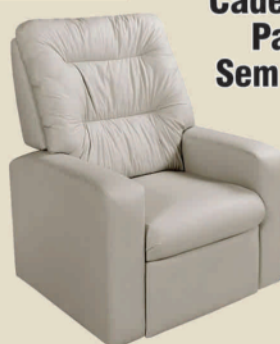
Cadeira do Papai Paris - Plus Sem articulação