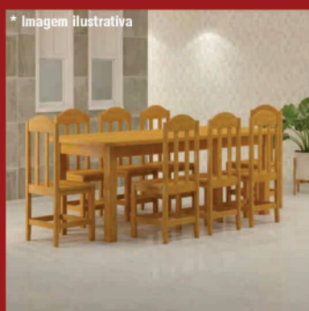
Mesa Gourmet c/ 8 cadeiras - 2m Móveis Tradição