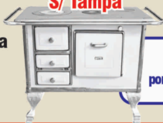
Fogão a Lenha Marumby Branco nº 1