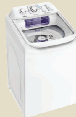
Lavadora Electrolux LED 12 kg