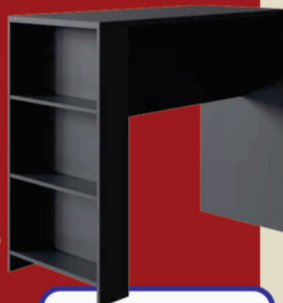
Bancada Luna CZ 6966 - Móveis IRM