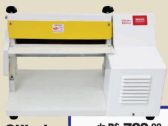
Cilindro Elétrico Malta