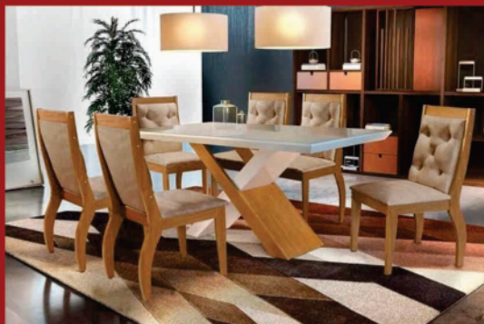
Mesa Jantar Tampo de vidro c/ 6 cadeiras